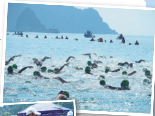
トライアスロン イメージ