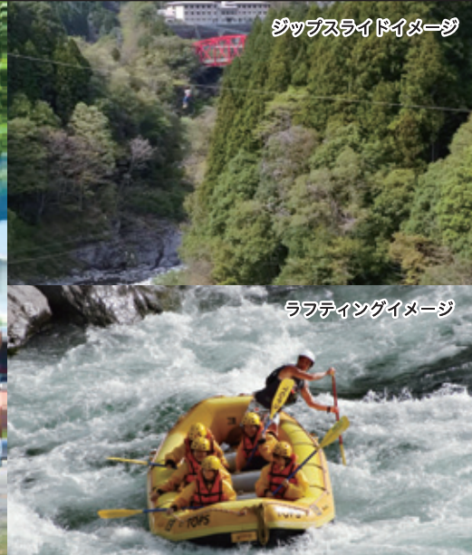
ラフティングイメージ