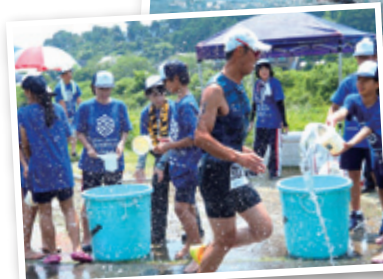
トライアスロンイメージ